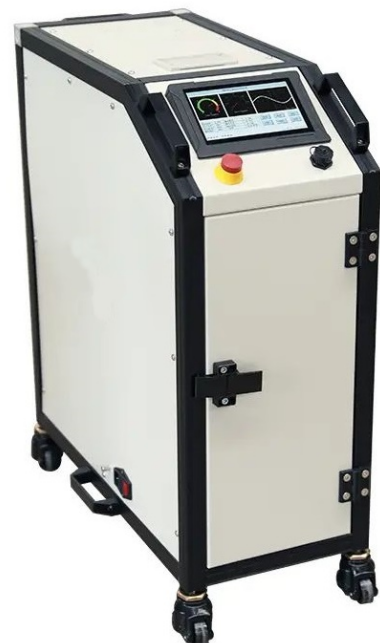
(VLF-60 або VLF-80)